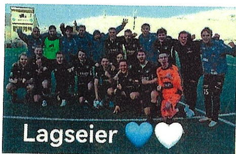
Cupseier mot Fløya i Tromsø

2.runde. Så både sportslig og økonomisk er cupen viktig for oss. Der 2.runde ga oss nesten 90000,- på kontoen 😊