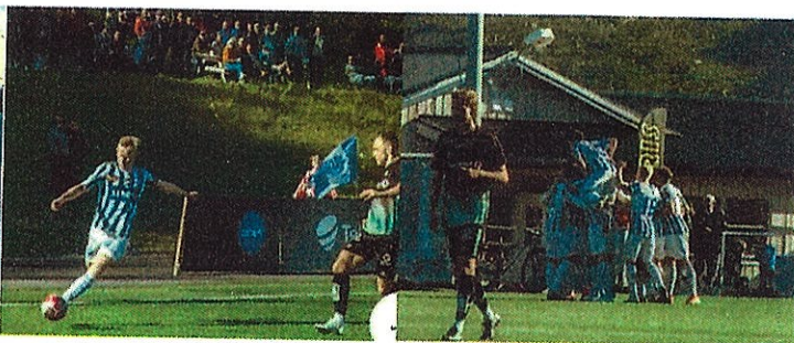
Mye folk og målfeiring i vår cupkamp mot TIL